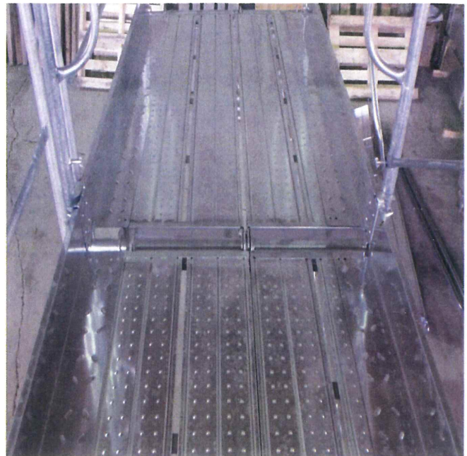
コンパクトな梱包状態